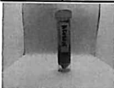
Foto del campione

Grado di umidità al momento dell'analisi - 14,15%